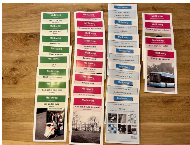
een deel van de nieuwe boekjes

Via een vrijwilliger hoorden we dat er gratis leermateriaal te downloaden is dat Melkweg heet. Melkweg is gemaakt voor mensen die nog niet goed kunnen lezen of schrijven, maar ook voor mensen die dat al wel kunnen, is het heel fijn materiaal.