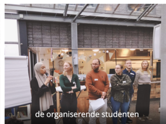
de organiserende studenten