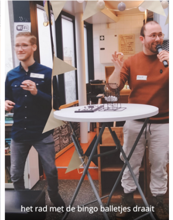
het rad met de bingo balletjes draait